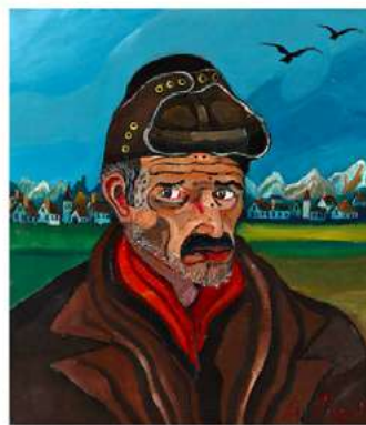
Antonio Ligabue. Autoritratto sd 1955-1956. Olio su tavola di faesite cm 45x35