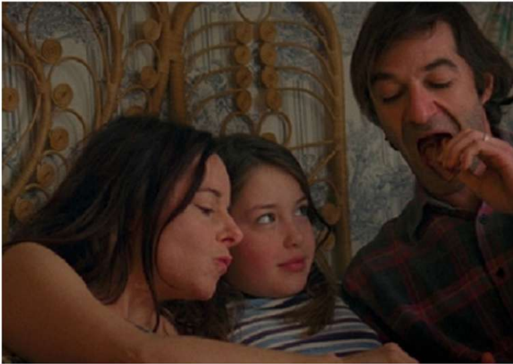
Louloute de Hubert Viel

🕒 09/10/2020 - La 11 e édition du festival vendéen se déroulera du 12 au 18 octobre avec près de 65 longs métrages en vitrine dont 35 en première française