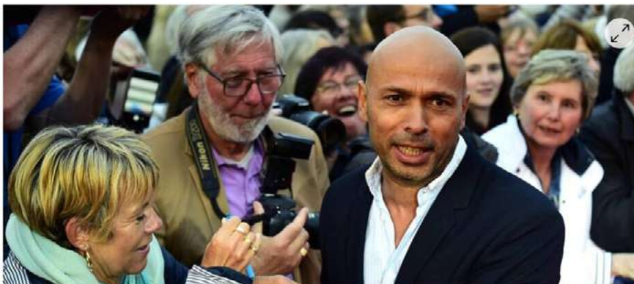
Éric Judor, (ici à Cabourg) sera présent à La Roche-sur-Yon, pour le festival du film, du 12 au 18 octobre.

Du 12 au 18 octobre, le Festival international du film de La Roche-sur-Yon recevra l'acteur-réalisateur Éric Judor.