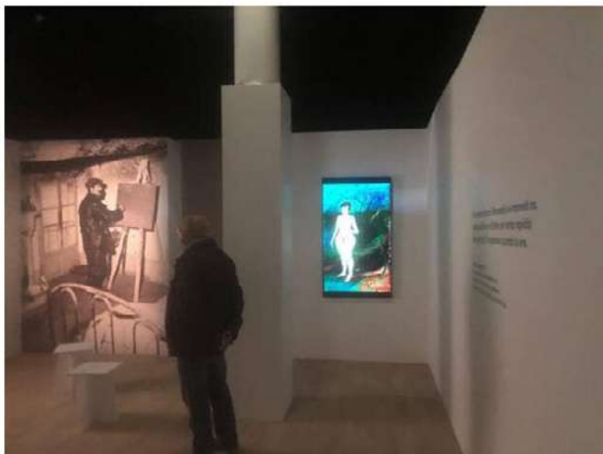
L'exposition Antonio Ligabue, montre les facettes de cet artiste méconnu.. | OUEST-FRANCE