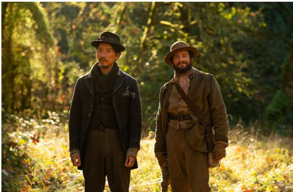
First Cow

First cow , le plus beau film du festival (et le plus beau de l'année s'il trouvait un distributeur), raconte l'amitié de deux hommes mais aussi la naissance d'une nation et du système qui la gouverne. Quatre ans après Certaines femmes , Kelly Reichardt revient à l'essence du western, genre crée de toutes pièces au cours du XIXe siècle pour doter un pays sans Histoire d'un mythe à la hauteur de ses ambitions. Les feuilletons, les romans, la peinture et bientôt le cinéma vont peu à peu nourrir la légende en construisant le genre. Loin de figures édifiantes, la cinéaste américaine raconte une histoire simple, à hauteur d'homme c'est à dire sur terre, littéralement. Magnifiquement mis en scène (image carrée, travail sonore ultra sensible), First cow atteint la grâce dès les premières images et déroule le fil d'un récit profondément doux malgré la rigueur du propos : il s'agit là de survivre et Kelly Reichardt, l'une des plus grandes réalisatrices actuelles, filme la vie.