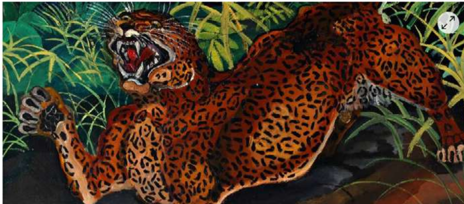
L'exposition Antonio Ligabue, Hors cadre se déroule, au Cyel jusqu'au 14 novembre.

Présentée dans le cadre du Festival international du film, l'exposition dédiée à ce peintre italien se tient jusqu'au 14 novembre. On vous explique pourquoi elle est inédite.