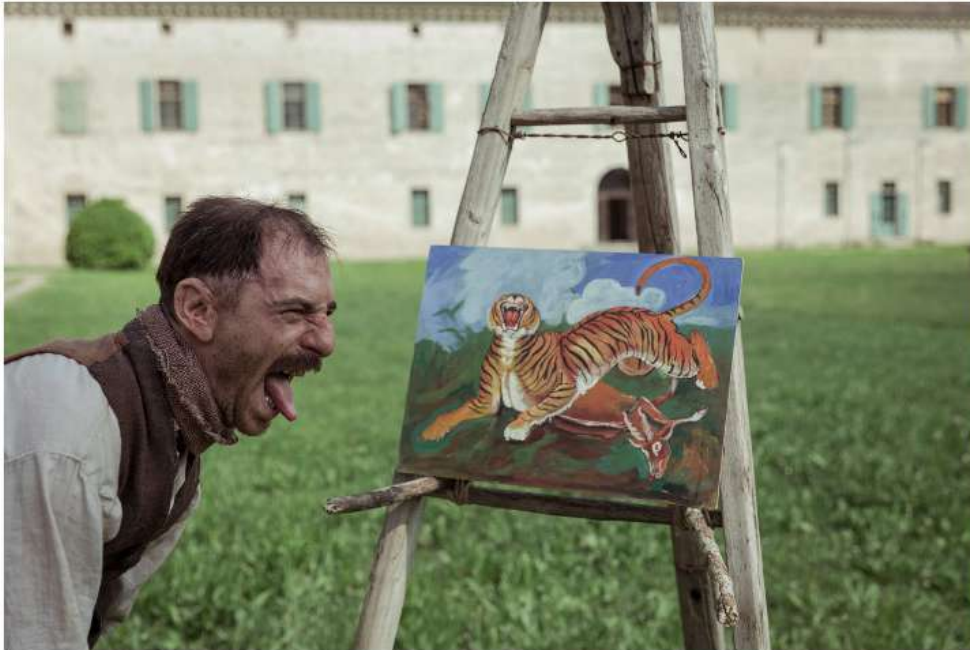
Je voulais me cacher

À mi-chemin entre la fiction pure, l'allégorie et un portrait contemporain du Lesoto, This is not a burial, it's a resurrection de Lemohang Jeremiah Mosese, impose la puissance formelle d'un récit aussi mystique que terrien (superbe musique de Yu Miyashita). Loin de se poser en opposant a priori d'un "progrès" imposé (ici, un village devant être immergé sous une réserve d'eau), le cinéaste brasse les thématiques éternelles du sens de la vie et de la mort en oscillant avec audace entre naturalisme et maniérisme.