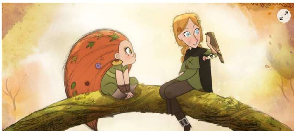
« Le Peuple loup », ce mercredi au Manège, ouvre la programmation jeune public.

Comme chaque année, une programmation spécifique est prévue pour le jeune public. Ça commence ce mercredi 14 octobre 2020 avec « Le Peuple loup », au Manège.