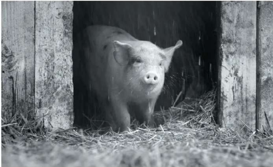
Gunda by Victor Kossakovsky

Victor Kossakovsky's Gunda will compete in International Competition at the 11th La Roche-sur-Yon festival (France) for the €15,000 distribution first prize. There are further doc selections in Perspective and Special Screenings sections. The festival, which organises a programme of 70 French premieres, runs 12-18 Oct 2020.