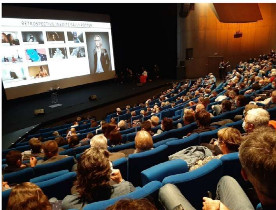
Malgré un contexte bousculé par l'épidémie de Covid-19, le Festival international du film de La Roche-sur-Yon a pu se tenir.

Rappelons que le budget du Festival international du film est de 550 000 €, largement financé par les collectivités publiques. ●