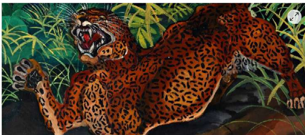
Pour l'exposition sur Ligabue au Cyel, des œuvres de l'artiste ont fait le voyage depuis l'Italie.

La 11 e édition s'ouvre lundi 12 octobre 2020 au soir dans un contexte sanitaire inédit, mais pas question de passer à côté de ses temps forts. Voici quelques-uns des moments à ne pas rater.