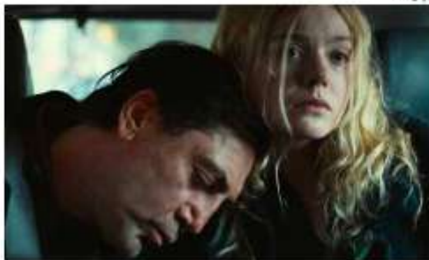
Ellen Fanning e Javier Bardem em cena em "Sonhos de Uma Vida"

"Acompanhei essa batalha dele de perto e percebi o sofrimento que foi para ele e para todos nós que o amávamos. Este filme é uma forma de entender como a demência afeta toda uma