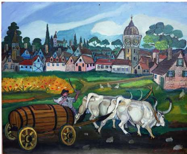
Antonio Ligabue. Bui con carro a botte sd 1953-1954. Olio su tavola di faesite cm 68x90

Nell'ambito dell'undicesima edizione del Festival International du Film de La Roche-sur-Yon sarà presentato il film “Volevo nascondermi” di Giorgio Diritti, premiato con l’Orso d’Argento alla Berlinale.