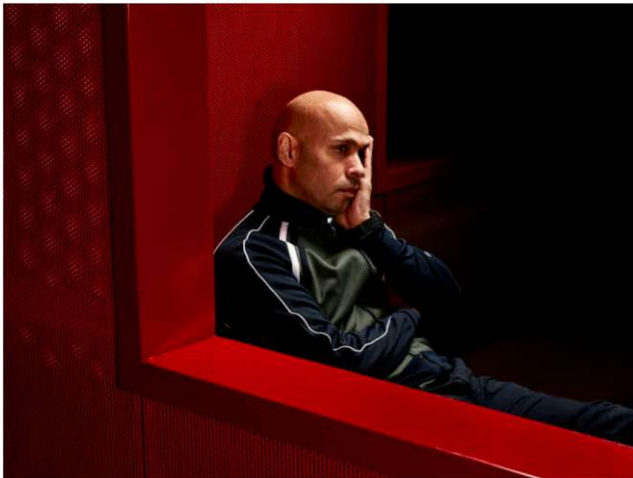
Eric Judor, en décembre 2019, à Paris.