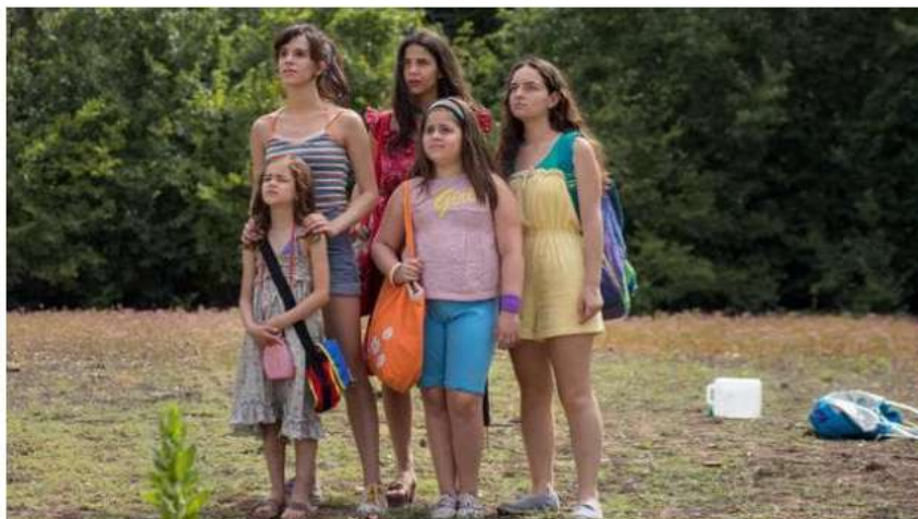
« Le sorelle Macaluso », un condensé de vie « vertigineux ».