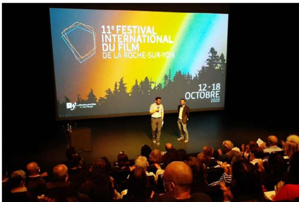
Jeu 23 septembre, les organisateurs du Festival international du film de La Roche-sur-Yon ont dévoilé une programmation ambitieuse.

Le 11e festival international du film de La Roche-sur-Yon se tiendra du 12 au 18 octobre 2020. Les organisateurs ont présenté, mercredi 23 septembre, une programmation exigeante.