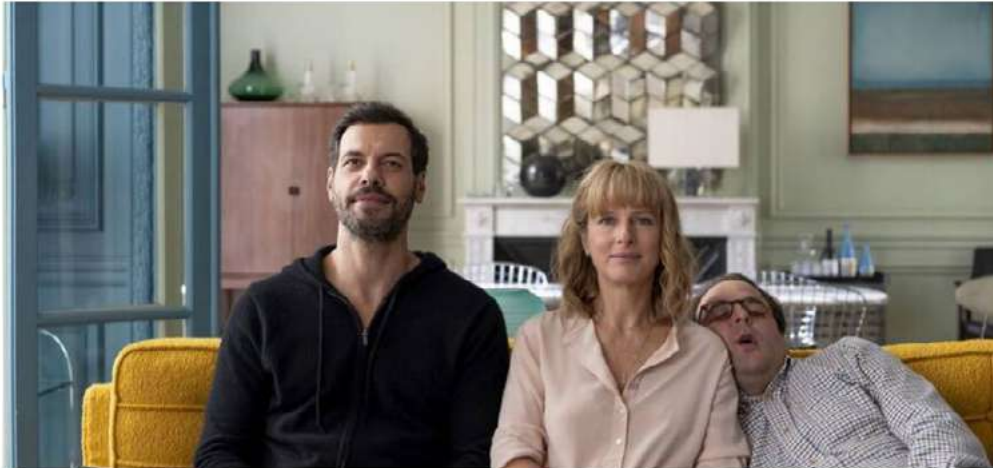
« L'origine du monde », de Laurent Lafitte, sera le premier à être diffusé lors du Festival international du film de La Roche-sur-Yon.

L'origine du monde, de Laurent Lafitte, sera le film d'ouverture de la 11e édition du Festival international de La Roche-sur-Yon, le 12 octobre. Les deux Alfred, le film de Bruno Podalydès, clôturera la semaine.