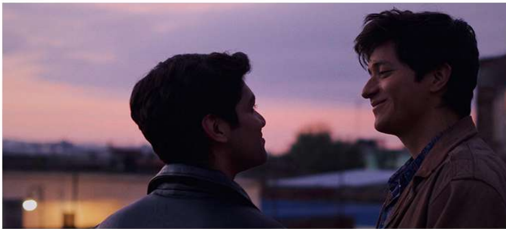
I carry you with me

Bien évidemment, le cinéma s'inspire aussi du "réel". Deux films majeurs de la sélection, aux approches radicalement différentes, en donnent une vision puissante. Racontant le destin aussi romanesque que périlleux de deux jeunes hommes amoureux passant la frontière pour quitter le Mexique et aller vivre à New-York, I carry you with me sonne comme la vraie surprise du Festival. Travaillant à partir de l'expérience vécue par un couple de ses amis, Heidi Ewing construit son récit en deux temps. Le basculement de la narration "fictionnelle" au documentaire, très subtilement amené, donne au film une puissance décuplée, l'identification aux personnages fortifiant alors l'empathie ressentie. Évoquant la question gay, le rapport aux racines, à la filiation et la paternité, ce long métrage primé à Sundance bouleverse.