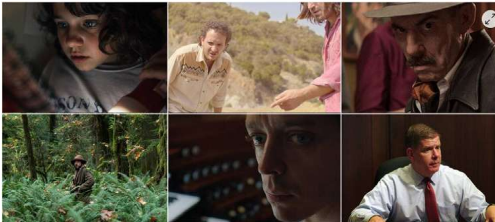
Les six premiers films de la programmation du Festival international du film de La Roche-sur-Yon ont été dévoilés mercredi 19 août.

Le Festival international du film de La Roche-sur-Yon doit se dérouler du 12 au 18 octobre.