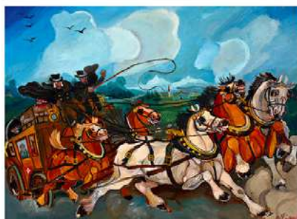
Antonio Ligabue. Diligenza con paesaggio e villa Casanova Rambelli sd 1953-1954. Olio su tavola di faesite cm 68x95

Il percorso espositivo sarà completato da un tour virtuale che amplierà la selezione delle opere in mostra attraverso alcuni dei capolavori presenti nella retrospettiva “Incompreso. La vita di Antonio Ligabue attraverso le sue opere”, visitabile fino al 13 dicembre 2020 nel Salone dei Giganti di Palazzo Bentivoglio a Gualtieri.