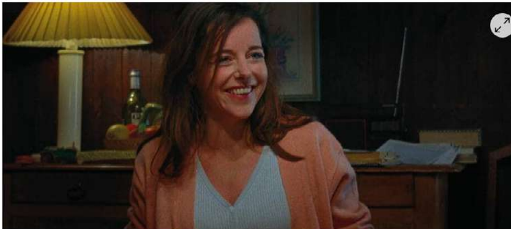
Le Grand prix du jury international Ciné + a été attribué à Louloute , d'Hubert Viel

La 11e édition du Festival international du film s'est achevée dimanche 18 octobre, avec l'annonce du palmarès, à La Roche-sur-Yon. Trois films ont été sacrés par le jury international.